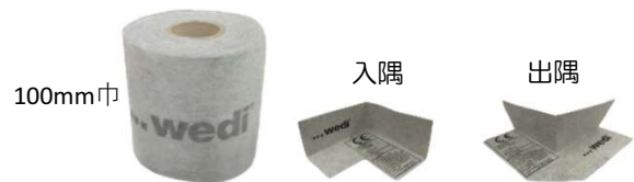
防水テープ(不織布製)