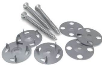
スチールワッシャー