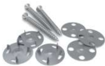
スチールワッシャー